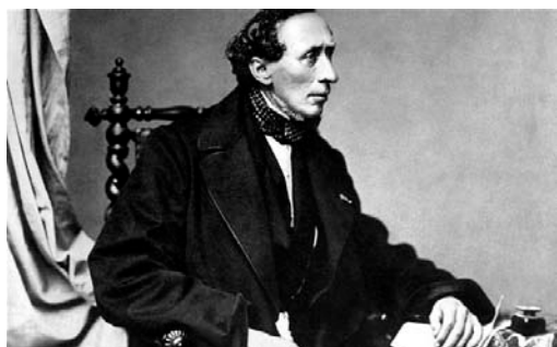
Hans Christian Andersen

Rubicon – 1868. szeptember 6. – Szendrey Júlia halála