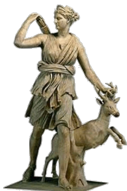
íj, nyíl, szarvas