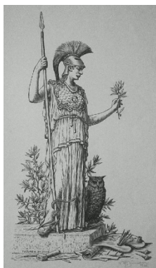
sisak, pajzs, bagoly