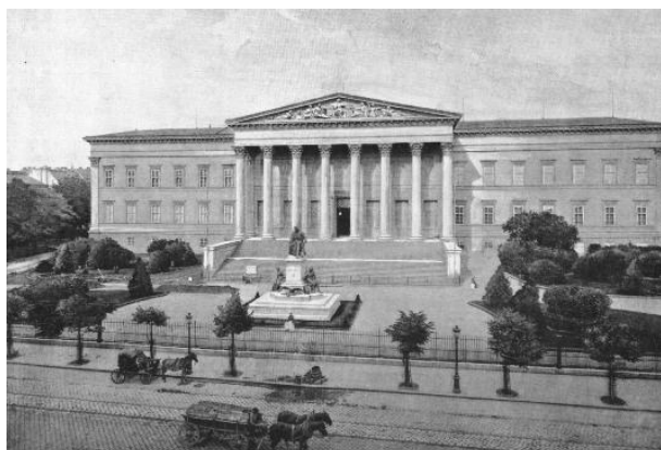
Pollack Mihály: Nemzeti Múzeum