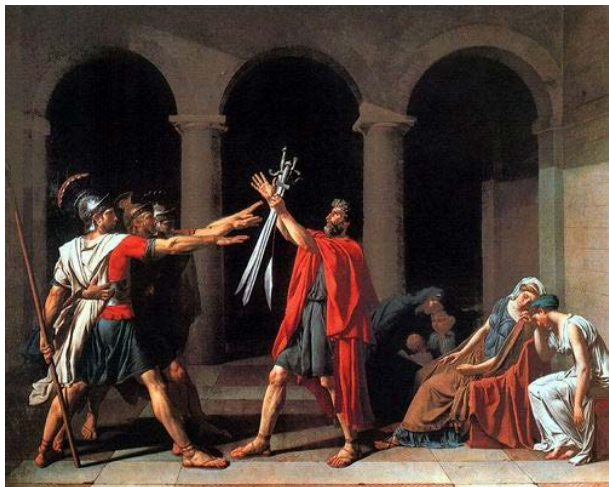
Jacques-Louis David: Horatiusok esküje