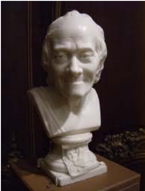
Jean-Antoine Houdon: Voltaire portrészobra