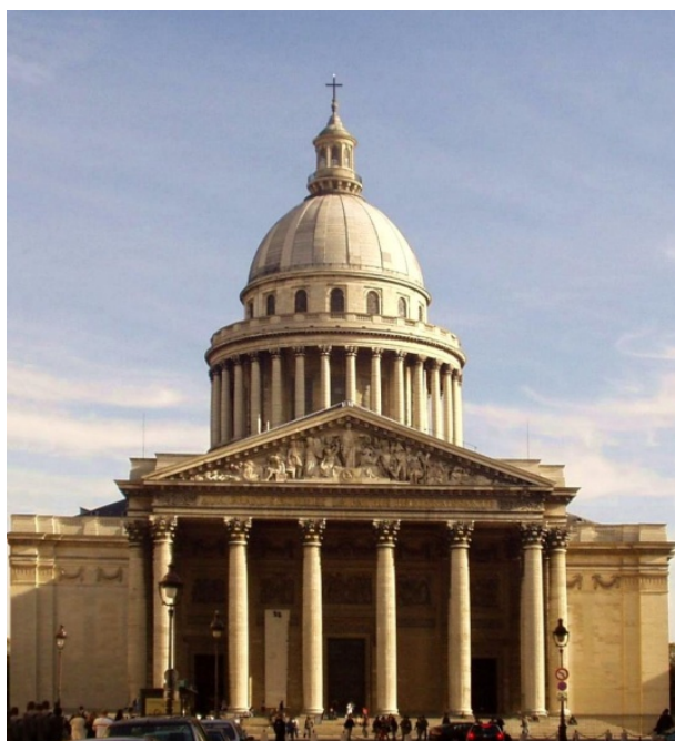
Jacques-Germain Soufflot: Pantheon, Párizs