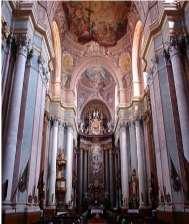
Templombelső – Szentgotthárd

3. Az alábbiakban barokk épületeket, szobrokat, festményeket láatsz. Vizsgáld meg őket, és gyűjts 10 jellemző barokk stílusjegyet!