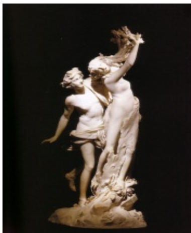
Bernini: Apollo és Daphné