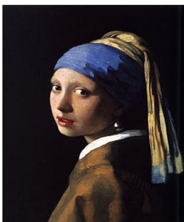
Vermeer: Leány gyöngy fülbevalóval