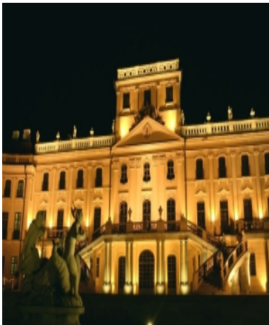
Esterházy-kastély – Fertőd