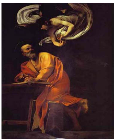
Caravaggio: Szent Máté és az angyal