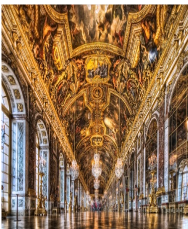
Versailles-i palota belseje – Párizs, Versailles