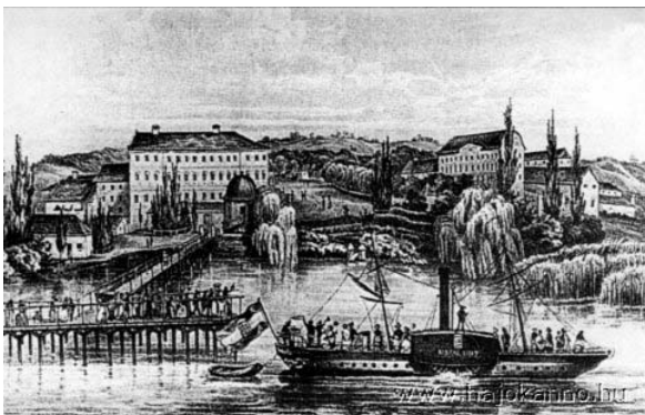
A Kisfaludy gőzhajó Füreden

Készíts bemutatót 8-10 diában arról, hogy az ipari forradalom újdonságai hogyan jelennek meg a reformkori Magyarországon! Térj ki arra, hogy a közlekedésben milyen változások történnek (hajózás, vasút), milyen iparágak születnek meg egy-egy gyár, vállalkozás elindításával, kik a kiemelkedő személyek! Segítségül megadunk három képet és néhány linket a kutatómunka elkezdéséhez.