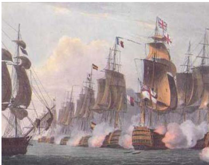
A trafalgari csata