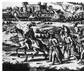
Portyázó vitézek foglyokat kísérik