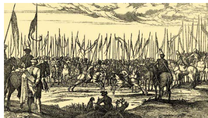
Párviadal magyar hadnagy és török bég között